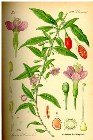
Tiré de: Wikipédia Baie de Goji, 2009, 13 février.

La zéaxanthine et la lutéine se trouvent bien sûr aussi dans d'autres fruits et légumes, comme le chou vert, les épinards, les pêches, etc.