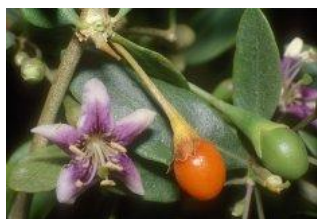
Tiré de EzNatural, 2009, 13 février.

Il est intéressant de constater que d'autres sources de complexes polysaccharides-protéines particuliers sont étudiées (par ex. dans certains champignons et dans la plante rehmannia ) et qu'ils semblent posséder des effets similaires (Cao, 1994). À l'avenir, cela pourrait représenter une autre possibilité de traitement des tumeurs, en stimulant fortement les capacités de défense de l'organisme, limitant ainsi les doses de cytotoxiques utilisées. De plus, Gong (2005) a démontré que le Lycium barbarum a la capacité de réduire les effets secondaires indésirables des chimio- et radiothérapies chez les souris.