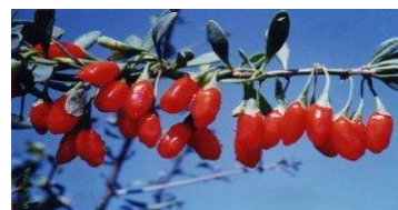
Tiré de EzNatural, 2009, 13 février.

S'il faut donc se méfier des allégations avancées sans un minimum d'explications correctes, il n'en reste pas moins que toutes les références mettent en avant le pouvoir antioxydant hors norme du fruit de Lycium barbarum.